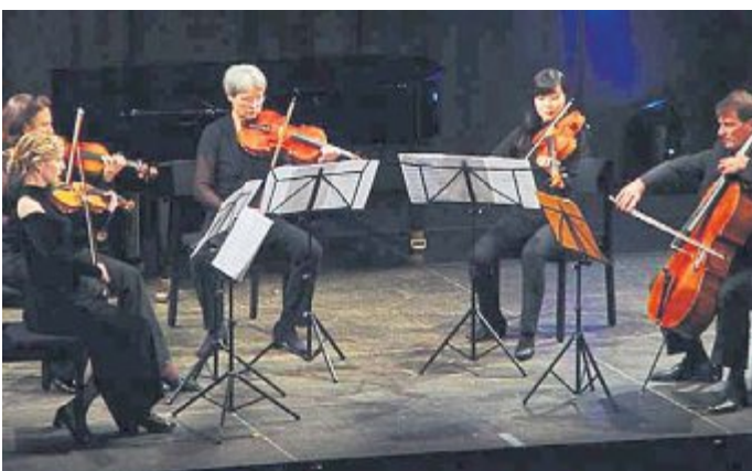
Die 2. Kammermusik Puchheim entführt im Februar auf einen kulturellen Waldspaziergang.