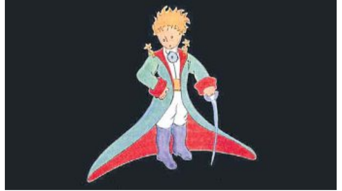
Man sieht nur mit dem Herzen gut: „Der kleine Prinz“ richtet sich an Kinder wie an Erwachsene.

„Man sieht nur mit dem Herzen gut. Das Wesentliche ist für die Augen unsichtbar.“ Das moderne Märchen „Der kleine Prinz“ von Antoine de Saint-Exupéry (1900-1944) ist eines der meist gelesenen Bücher überhaupt und wird oft als Plädoyer für Freundschaft und Menschlichkeit verstanden. Die etwa 90-minütige multimediale Lesung des aus Film und Fernsehen bekannten Schauspielers