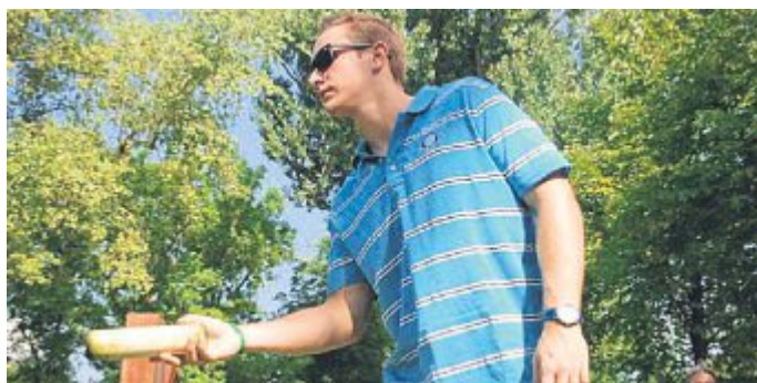
Das 4. Puchheimer Mölkky-Turnier am 1. Juli 2017 gehört zu den Höhepunkten im DFC-Jubiläumsjahr.

Puchheim“ des Kulturvereins Puchheim e.V. vom 13. September bis 1. Oktober 2017; ★ Jubiläumsfeier im Puchheimer Kulturzentrum PUC am 16. September 2017, Ver-