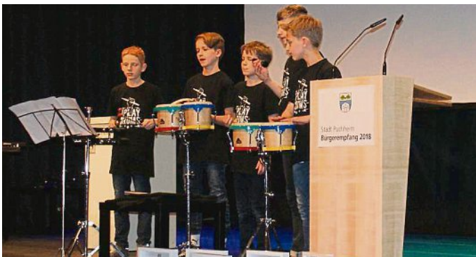
Für die musikalische Einstimmung sorgte das Percussionensemble der Musikschule Puchheim.

Die sieben Geehrten werden auf Seite 3 in Kurzporträts vorgestellt.