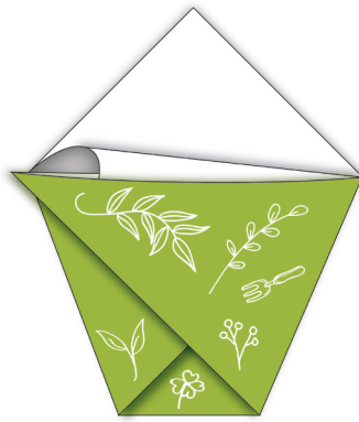
Falz 4 hält das Tütchen zusammen

Diese Vorlage auf A4 ausdrucken. Das Quadrat abschneiden und die Tüte der Reihenfolge nach falzen.