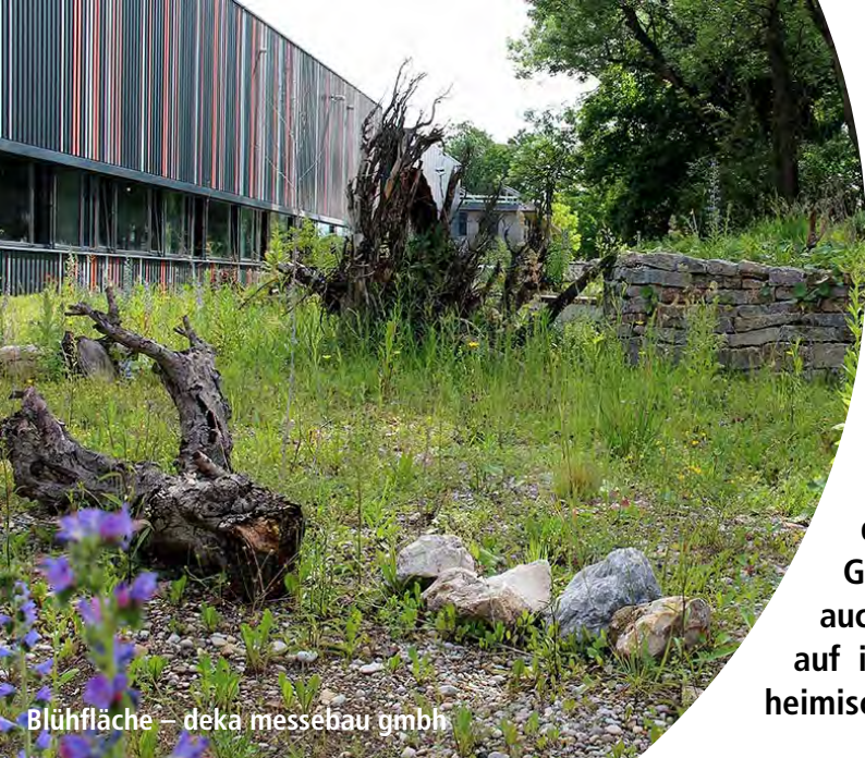
Blühfläche – deka messebau gmbh