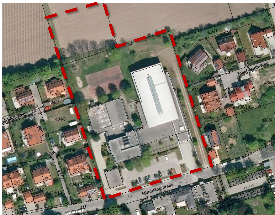
Abb. 1 Plangebiet, ohne Maßstab, Stand 12.05.2021

Das Plangebiet ist durch zahlreiche einzelne Gehölze begrünt. Im nordwestlichen Bereich des Grundstücks Fl.Nr. 435/1 sind zusammenhängende Gehölzstrukturen vorhanden.