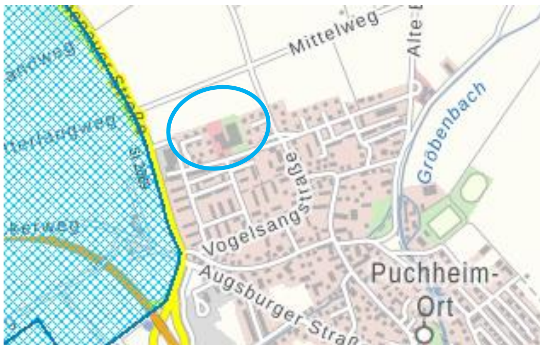
Ausschnitt UmweltAtlas Bayern Gewässerbewirtschaftung Basiskarte: ATKIS: © 2021 Bayerische Vermessungsverwaltung, Geofachdaten: © Bayerisches Landesamt für Umwelt